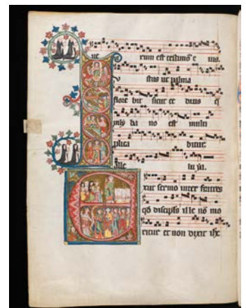
Zürich, Schweizerisches Nationalmuseum, LM 26117, f. 161v – Gradual from St. Katharinenthal (Thurgau)